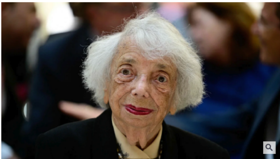
Margot Friedländer merkt man ihr Alter nur daran, dass sie beim Reden lieber sitzt als steht - hier bei der Verleihung des Walther-Rathenau-Preises am 4. Juli 2022 in Berlin.

4. Juli 2022, 20:33 Uhr | Lesezeit: 3 min | 13 Kommentare NEU