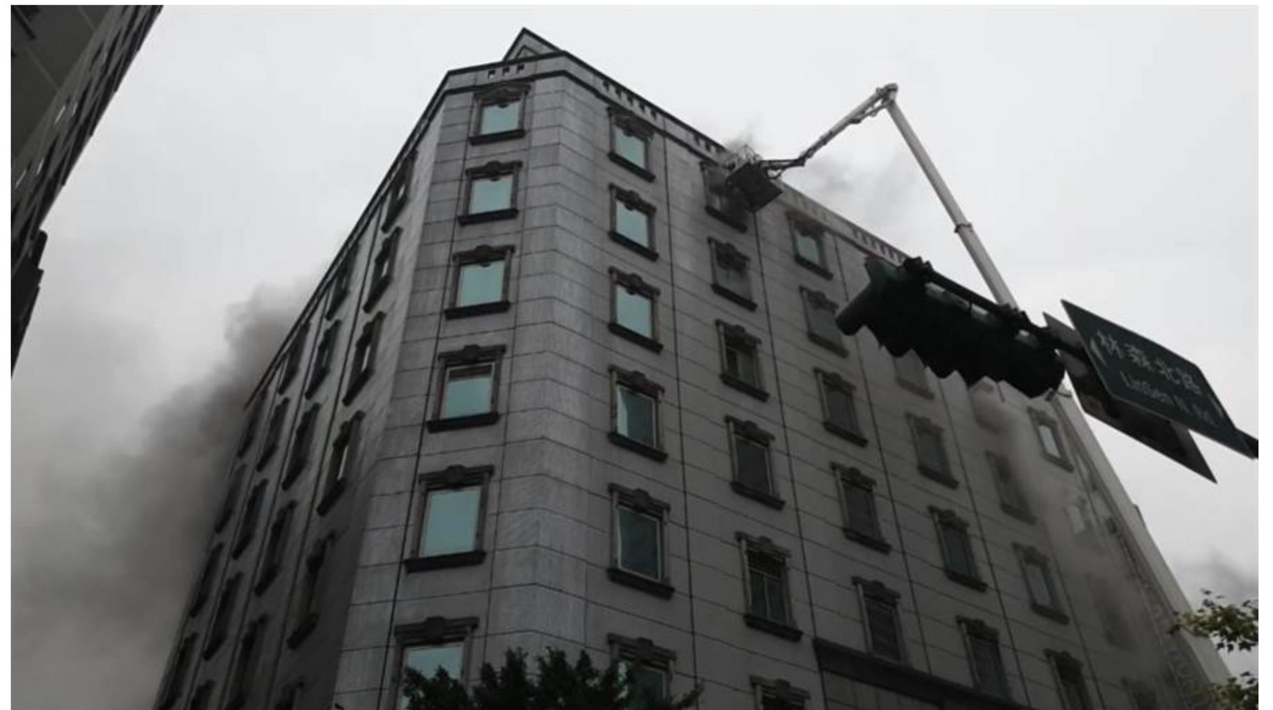
北市林森北路錢櫃火災 歡唱民眾多人待援