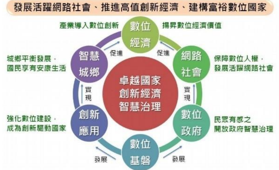
數位國家・創新經濟發展方案發展願景